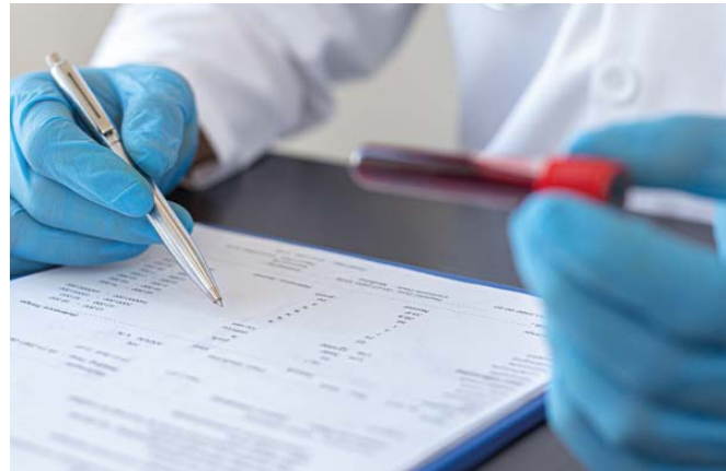
Vielfältige, moderne Untersuchungsverfahren.

Alle Untersuchungen erfolgen nach aktuellen medizinischen Leitlinien und mit größtmöglicher Sorgfalt.